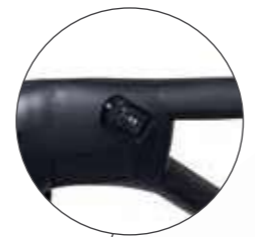
UNA VELOCITÀ ONE SPEED UNA VELOCIDAD