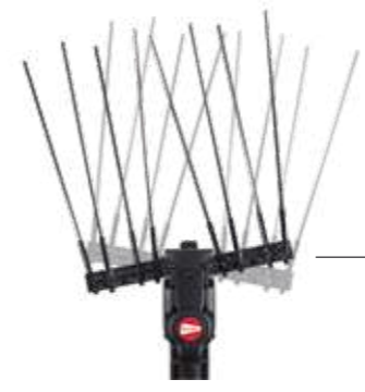
MOVIMENTO A BRACCI PARALLELI PARALLEL ARMS MOVEMENT MOVIMIENTO CON BRAZOS PARALELOS

1 VELOCITÀ - ASTA FISSA IN CARBONIO DA 220 cm 1 SPEED - FIXED CARBON ROD 220 cm 1 VELOCIDADES - VARILLA FIJA DE CARBONO 220 cm