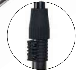
SERRAGGIO FAST BLOCK E ASTA CON ANTIROTAZIONE Fast Block tightening and anti-rotation pole Movimiento de espejo con brazos opuestos