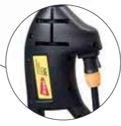
CONNETTORI FAST-PLUG FAST PLUG CONNECTIONS CONECTORES FAST-PLUG